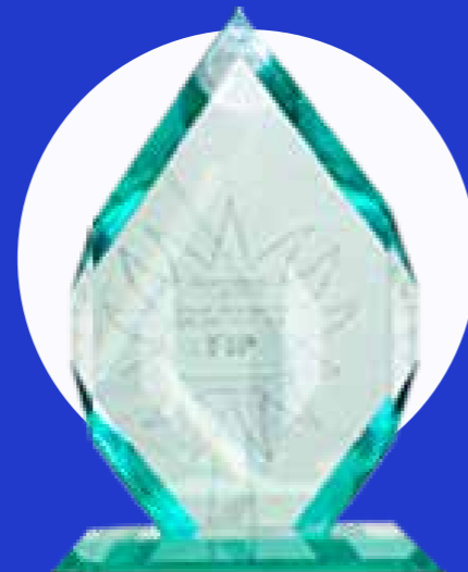
FIP de Cristal