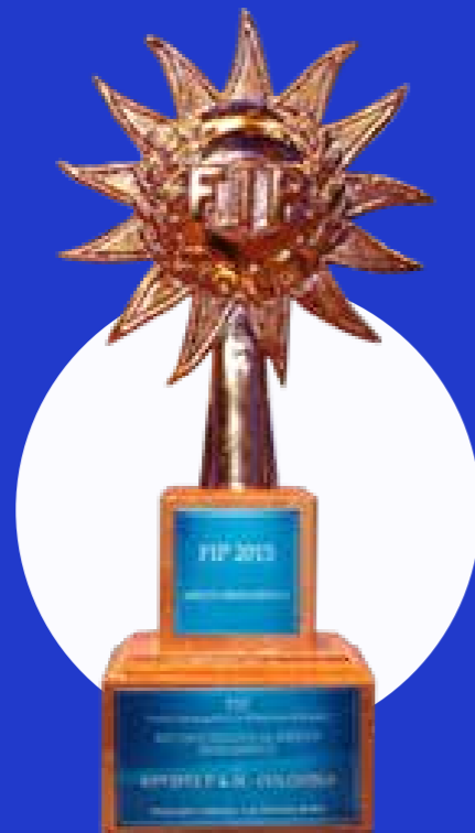
Marca del año